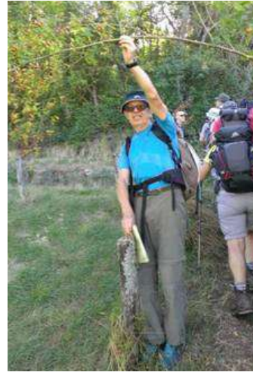
Le galant homme...