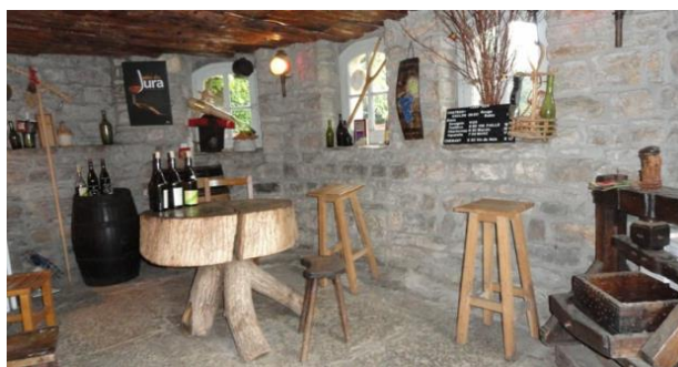
Domaine Courbet à Nevy-sur Seille