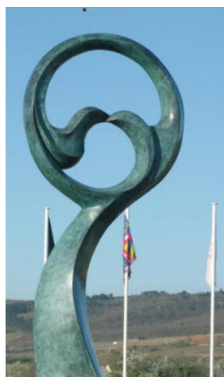
Marsannay la Côte