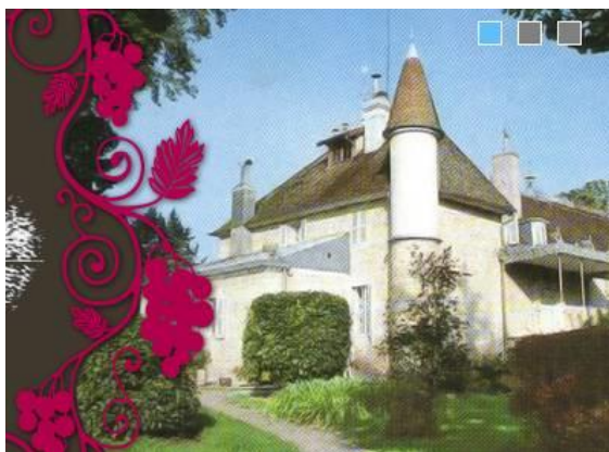
Château de l'Etoile