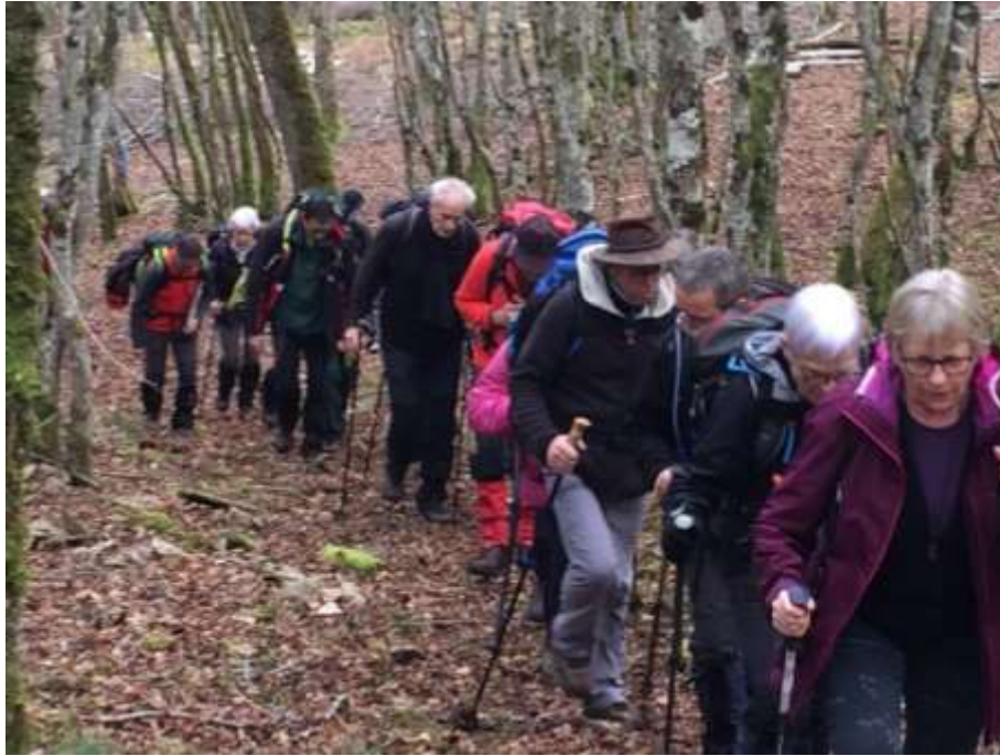
Pas beaucoup de sourires, personne ne cause...