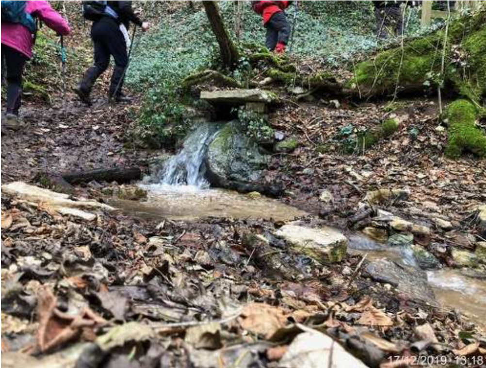
La source de la Tuilerie