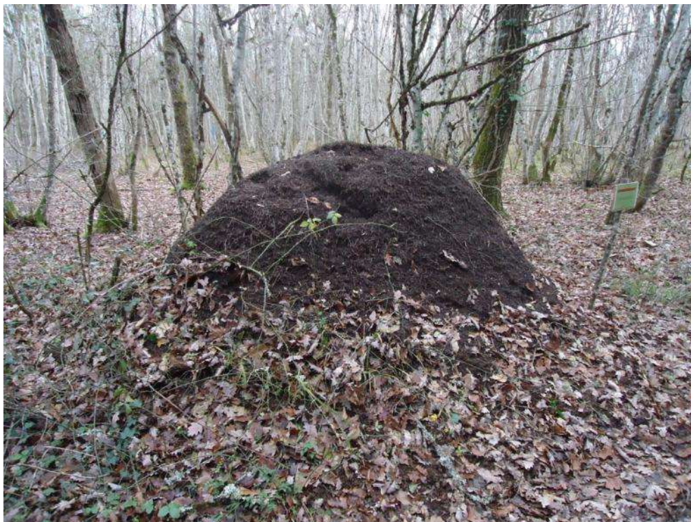
On rencontre de nombreuses fourmilières « protégées » le long des sentiers.