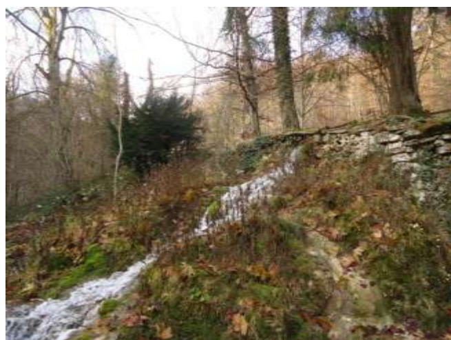
Que d'eau, que d'eau...