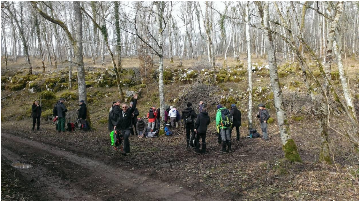
Pause thé-café dans le chemin des combes

Plutôt que la beauté du paysage, assez quelconque, on apprécie surtout le calme et la douceur des pentes : on grimpe sans s'en apercevoir... ou presque.