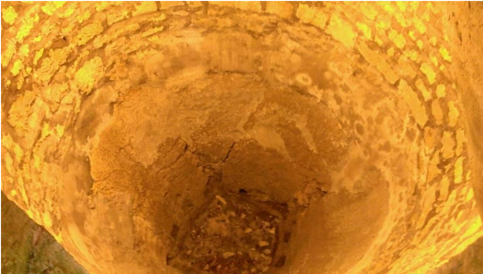
Fond du trou de la de la glacière

C'est l'endroit idéal pour faire la pause café-thé, même si on est juste à la porte du cimetière !