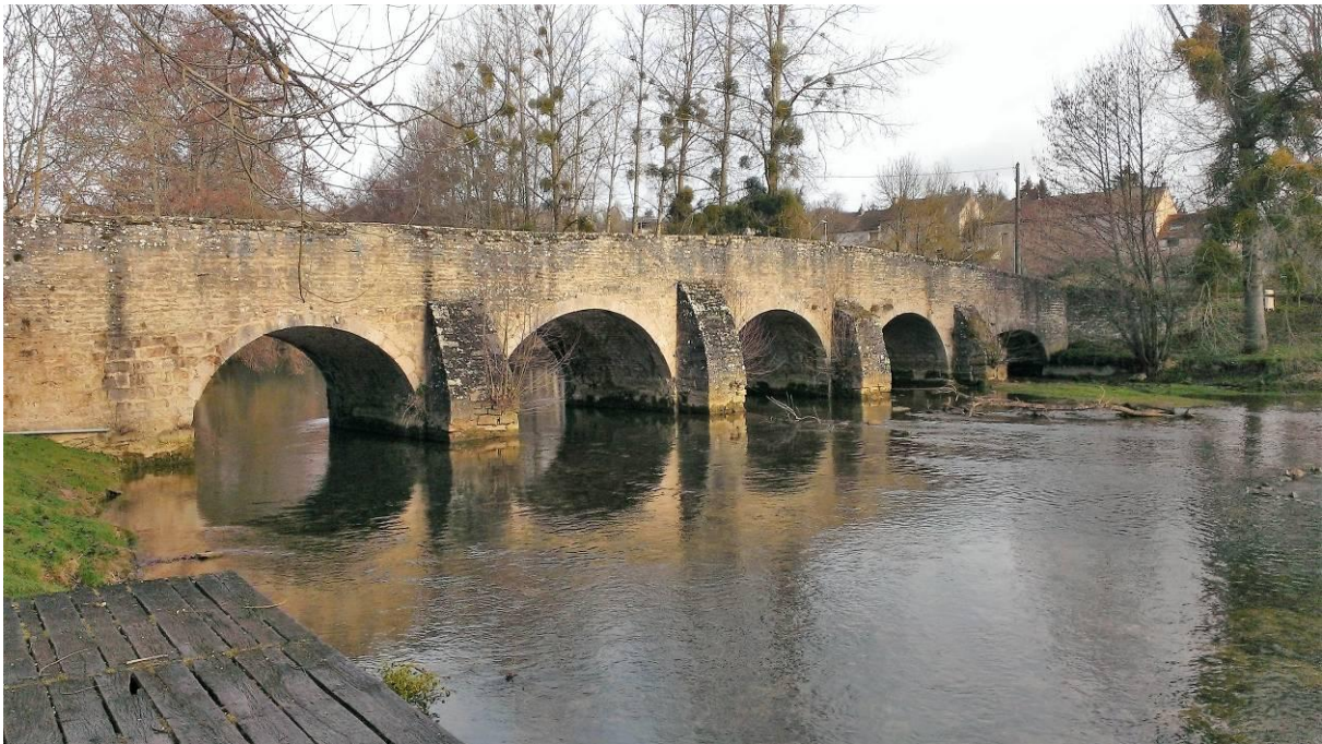
Le pont romain sur l'Ouche à Ste-Marie/Ouche

Le pont en pierre, en dos d'âne, à cinq arches en plein cintre avec avant-becs triangulaires est dit "romain", mais sa construction ne date, sans doute, que du 18 e siècle. Il n'en rehausse pas moins le charme bucolique du lieu.