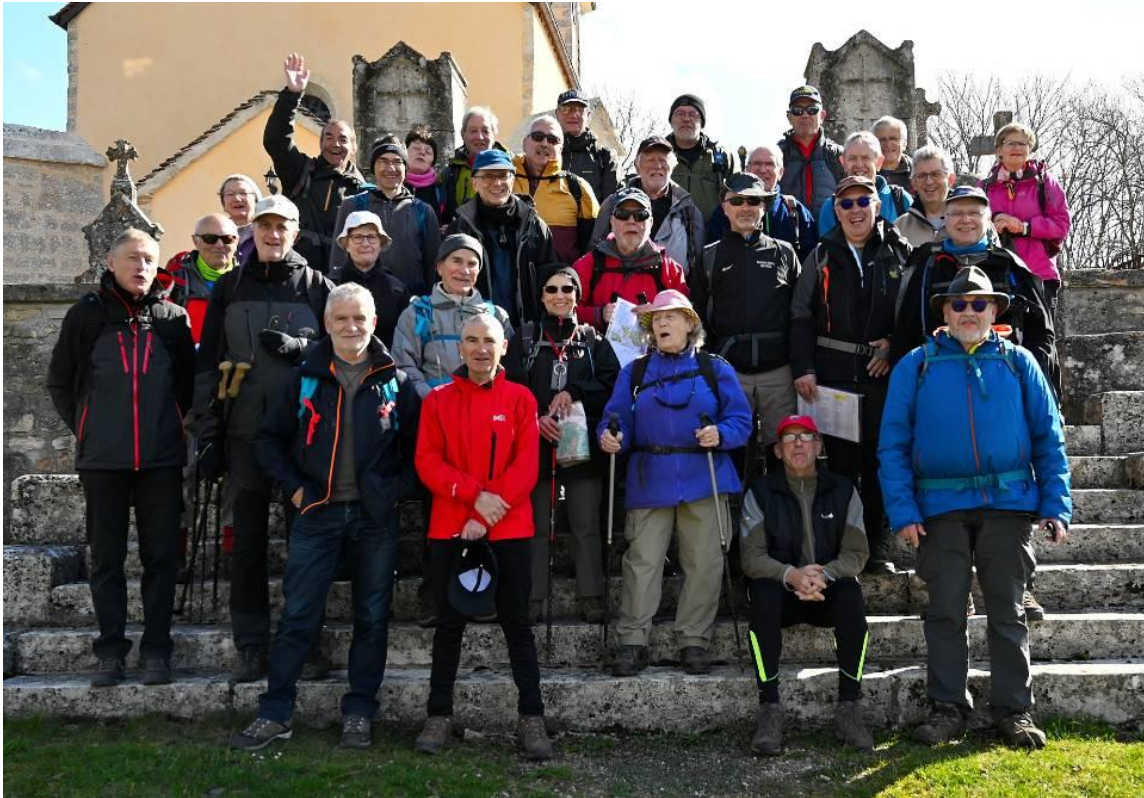
Belle affluence pour une journée qui s'annonce agréable

C'est la première fois que nous faisons cette randonnée dans le sens horaire, on part donc en longeant le bois d'Is-sur-Tille par le sud, pour arriver assez rapidement à Diénay où se trouve une intéressante curiosité, à savoir une ancienne glacière restaurée et dont l'origine doit remonter au 17 ème ou 18 ème siècle. C'était le réfrigérateur communal de l'époque.