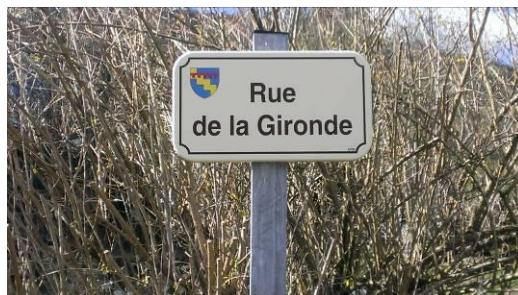
Oui, on est bien en Côte d'Or