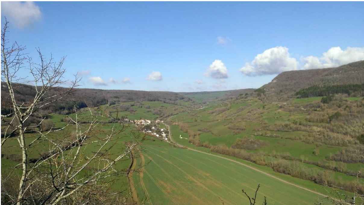
La vallée de la Gironde vue depuis la table du druide, avec le village de Jaugey dans l'arrière plan

Comme c'est souvent le cas, on commence par une longue montée qui nous amène à la table du druide, gros rocher dominant la vallée de la Gironde (celle-ci ne passe pas par Bordeaux) et premier très beau panorama.