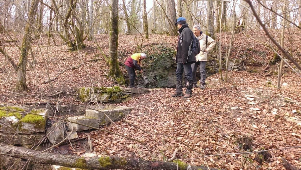
Les trois premiers bassins de la source de 7 fontaines

La montée vers le bois de la Brosse se fait en pente douce. On est donc très surpris, en arrivant à l'entrée du bois, de se retrouver face à un raidillon très, très pentu. Rien qu'à le regarder ça vous coupe les jambes. Et bien, même les trois octogénaires (ou presque) l'ont gravi avec succès !