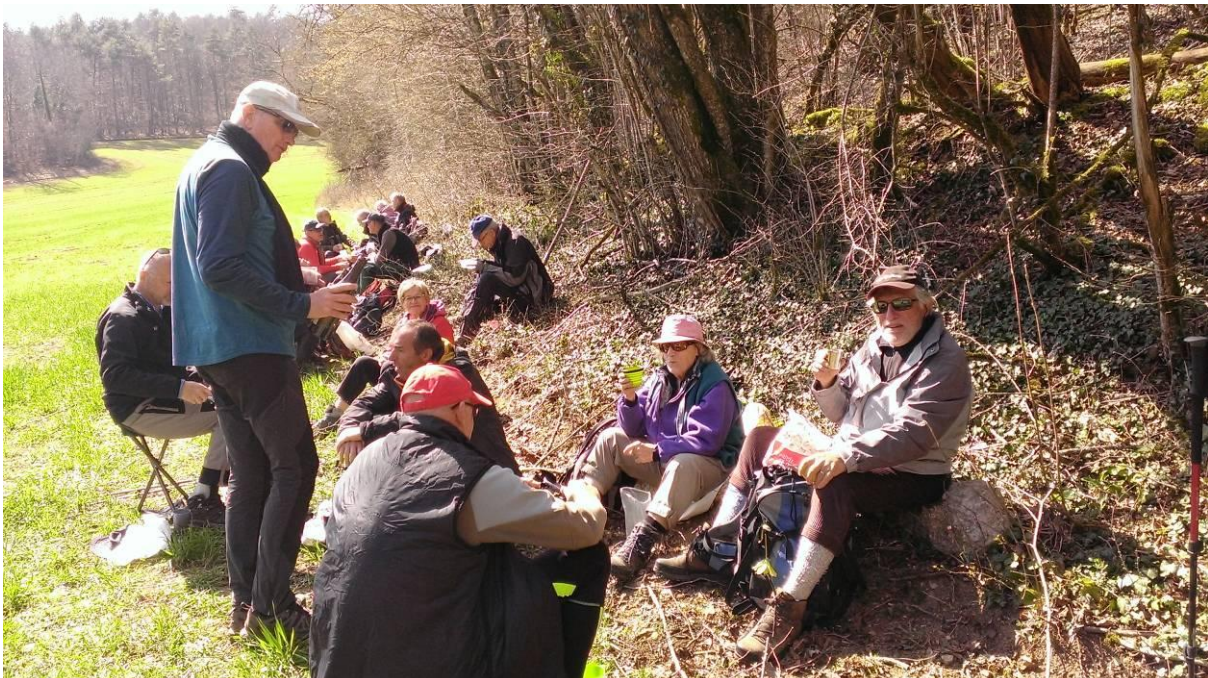
C'est déjà le printemps !

Bien sûr, une fois en haut, il faut redescendre et comme c'est l'heure de manger, on essaye de trouver un endroit peu venté. On préfère descendre dans la combe de Marceveau, près de la fontaine éponyme et là on trouve un bel endroit ensoleillé et à l'abri du vent.