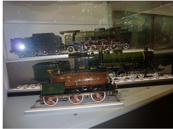
Maquettes de locomotives à vapeur

Le Pavillon de l'Industrie présente également des productions d'aujourd'hui. Nous pouvons admirer des pièces de très haute technologie : une demi-plaque entretoise d'un générateur de vapeur d'une centrale nucléaire, un arbre de compresseur centrifuge, un longeron de bogie de RER.