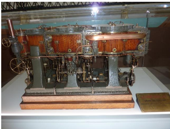
Machine motrice de l'ALGER 8000 chevaux.

Le Pavillon de l'Industrie présente également des productions d'aujourd'hui. Nous pouvons admirer des pièces de très haute technologie : une demi-plaque entretoise d'un générateur de vapeur d'une centrale nucléaire, un arbre de compresseur centrifuge, un longeron de bogie de RER.