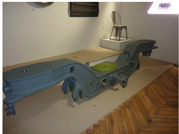
Longeron de bogie de RER

La visite est ponctuée par un film exceptionnel d'un peu plus de dix minutes sur écran géant. Nous sommes plongés au cœur de l'industrie d'aujourd'hui, de sa haute-technologie, dans le bruit et la fureur de la production des aciers et des gigantesques machines à la précision au 10 e de millimètre. Le tout est piloté par des femmes et des hommes qui ont choisi de destiner leur savoir-faire à construire un avenir innovant !